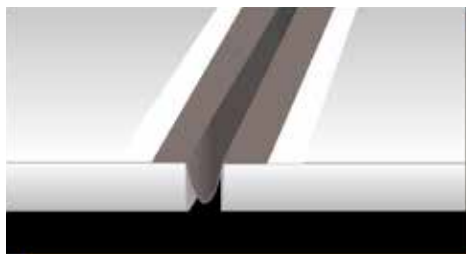
Mapeband PE 120 omega formában elhelyezése mozgási hézagban