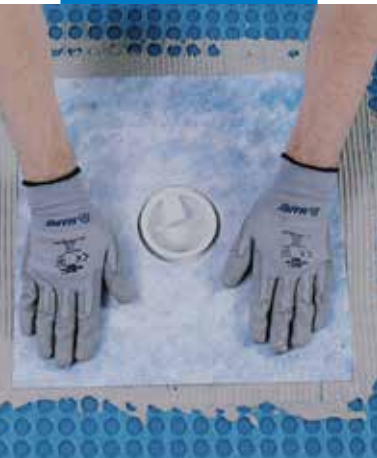
Lefolyók vízszigetelése Drain Vertical/Drain Lateral-lal