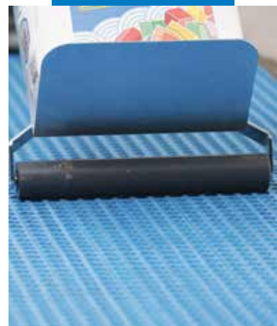
Mapeguard UM 35 lehengerezése