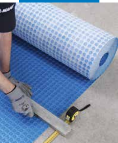
A Mapeguard UM 35 vágása