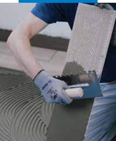
Kerámia vagy kő burkolat fektetése a megfelelő, legalább C2-es MAPEI ragasztóval