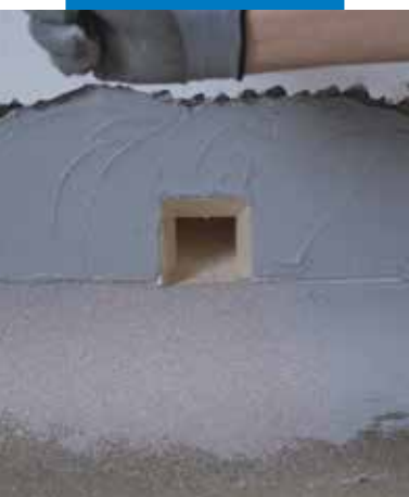
Csatorna vízszigetelése Drain Front-tal