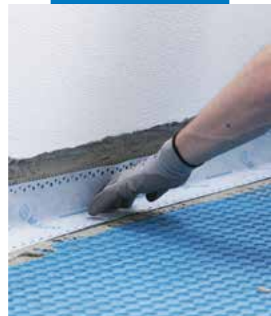
A szélek vízszigetelése Mapeband Easy-vel, Mapeguard WP ragasztóval ragasztva