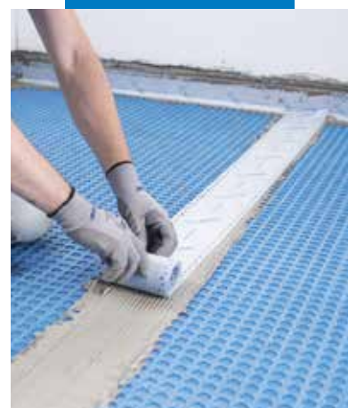
Lemek közötti csatlakozások vízszigetelése Mapeband Easy-vel, Mapeguard WP ragasztóval ragasztva