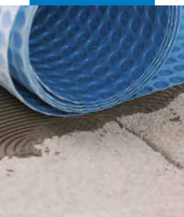
A Mapeguard UM 35 fektetése