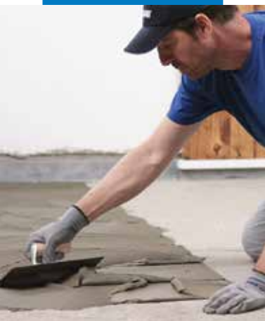
Ragasztó felhordása 5-ös számú fogazott simítóval